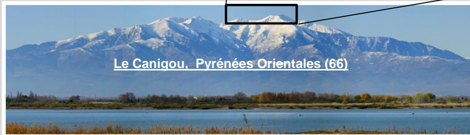
Le Canigou, Pyrénées Orientales (66)

L'observation du Canigou depuis la région phocéenne suscite à la fois l'enthousiasme et une certaine incrédulité. Il faut dire que cette galéjade vieille d'un peu plus de deux cents ans a la vie dure. Pourtant la magie du spectacle opère à chaque fois, et ceux qui y ont assisté en gardent un souvenir impérissable ; les autres attendent encore l'occasion à saisir pour découvrir un spectacle des plus extraordinaires comme seule la nature en a le secret. Des conditions extraordinaires au Soleil couchant se conjuguent à la fois sur le plan géographique et astronomique pour ce phénomène unique. En raison de la courbure de la Terre, le Canigou (altitude 2785m, Pyrénées Orientales) distant de plus de 250 km de Marseille ne devrait pas être visible.