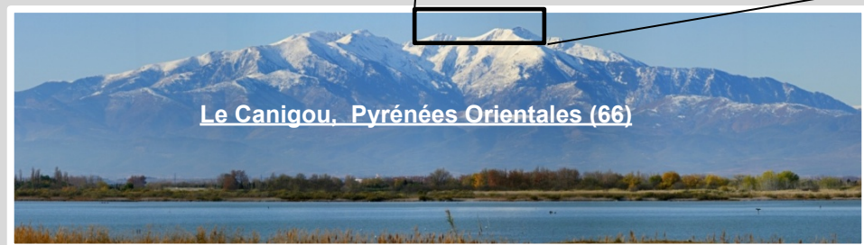
Le Canigou, Pyrénées Orientales (66)

L'observation du Canigou depuis la région phocéenne suscite à la fois l'enthousiasme et une certaine incrédulité. Il faut dire que cette galéjade vieille d'un peu plus de deux cents ans a la vie dure. Pourtant la magie du spectacle opère à chaque fois, et ceux qui y ont assisté en gardent un souvenir impérissable ; les autres attendent encore l'occasion à saisir pour découvrir un spectacle des plus extraordinaires comme seule la nature en a le secret. Des conditions extraordinaires au Soleil couchant se conjuguent à la fois sur le plan géographique et astronomique pour ce phénomène unique. En raison de la courbure de la Terre, le Canigou (altitude 2785m, Pyrénées Orientales, dept.66) distant de plus de 250 km de Marseille ne devrait pas être visible.