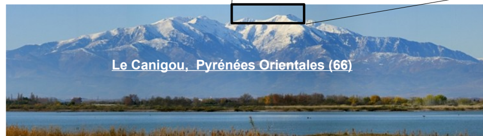
Le Canigou, Pyrénées Orientales (66)