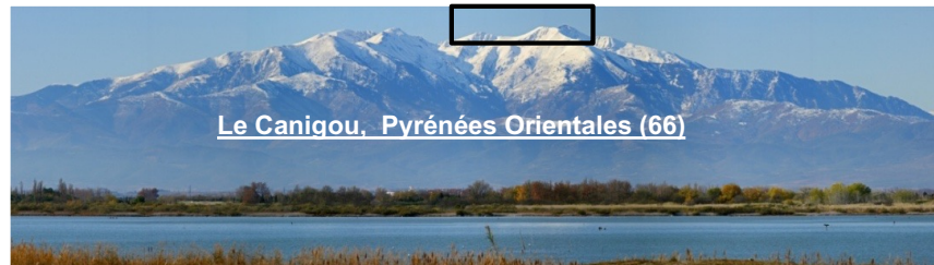
Le Canigou, Pyrénées Orientales (66)

L'observation du Canigou depuis la région phocéenne suscite à la fois l'enthousiasme et une certaine incrédulité. Il faut dire que cette galéjade vieille d'un peu plus de deux cents ans a la vie dure. Pourtant la magie du spectacle opère à chaque fois, et ceux qui y ont assisté en gardent un souvenir impérissable ; les autres attendent encore l'occasion à saisir pour découvrir un spectacle des plus extraordinaires comme seule la nature en a le secret. Des conditions extraordinaires au Soleil couchant se conjuguent à la fois sur le plan géographique et astronomique pour ce phénomène unique. En raison de la courbure de la Terre, le Canigou (altitude 2785m, Pyrénées Orientales, dept.66) distant de plus de 250 km de Marseille ne devrait pas être visible.